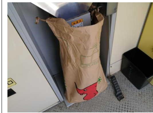
←寄贈して下さった千葉県産のコシヒカリは、さっそく精米して、ひとり親家庭などへ配布しました。

そのひとつが、何人もの方々から食品寄贈のお話しをいただくことです。いろいろなフードバンクで耳にするのは、主食のお米がなかなか集まらないという悩みですが、今回お話しをいただいた中に「お米」の寄贈がありました。5kgでも嬉しいのですが、今回は30kgの袋を8つも寄贈してくれた方がいらっしゃいました。千葉県成田市の会社社長からの寄贈で、国際文化交流研究会では、ワクワクしながらお米をいただきにクルマを走らせました。寄贈して下さったのは千葉県産のコシヒカリで、大半を玄米の状態下さり、当方が配布する直前に精米すればフレッシュなお